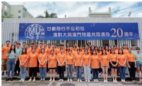
▲ 交换生及国际学院学生大使合照