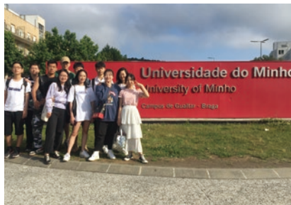
▲ 国际学院学生赴葡萄牙米尼奥大学交换