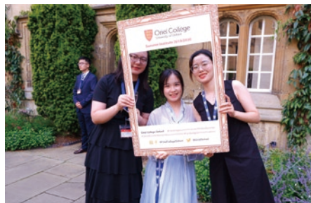
▲ 英国牛津剑桥暑期项目